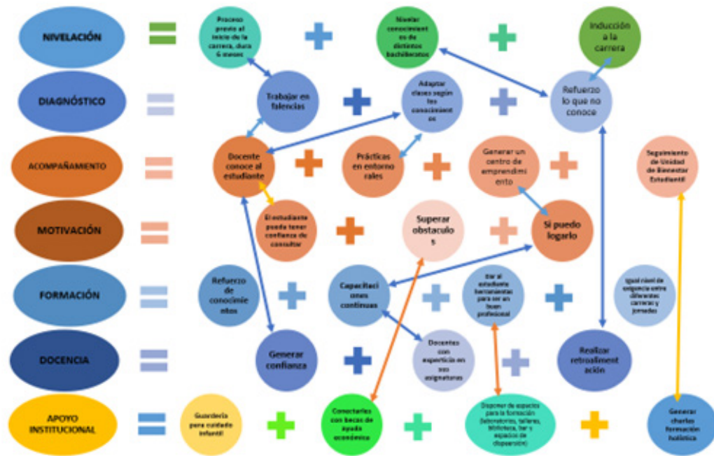
Figura 1. Mapa de estrategias.

De este modo se plantea las estrategias como buenas prácticas educativas para mitigar el problema de repitencia y deserción estudiantil, además se las concibe como una mirada sobre el sistema educativo que debe estar acorde a la realidad del territorio, como se aprecia en la figura 1.