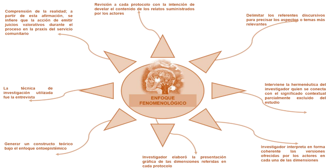
Figura 1. Soporte metodológico