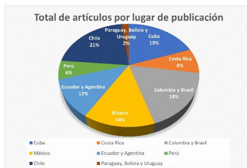
Gráfico 1. Los artículos publicados en los últimos 4 años en América.

A partir de los resultados se evidencian esfuerzos para integrar la enseñanza por medio del fortalecimiento del pensamiento crítico. En los seis artículos seleccionados se evidencia la integración de las habilidades críticas en la práctica educativa. Esta selección respondió a la organización de los hallazgos en la producción académica ecuatoriana sobre el pensamiento crítico.